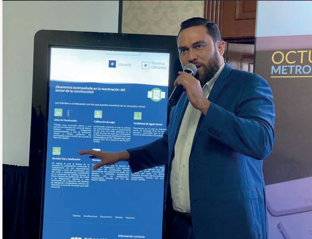
FOTOGRAFÍA Lanzamiento de Ventanilla Virtual